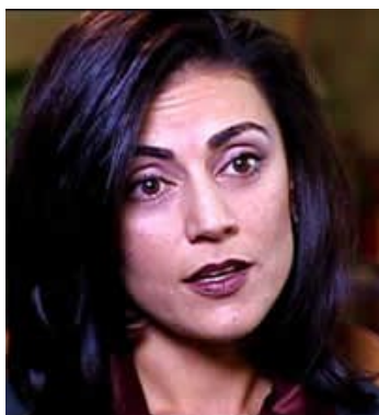
Sibel D. Edmonds