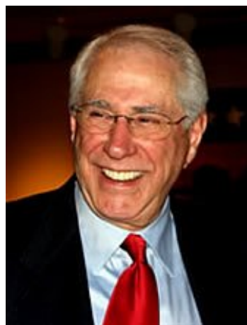
Sénateur Mike Gravel