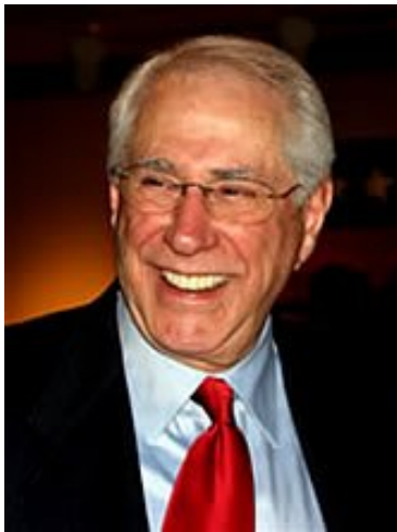
Senator Mike Gravel