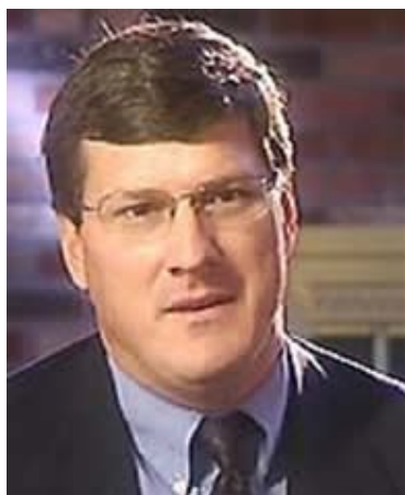
Maj. Scott Ritter